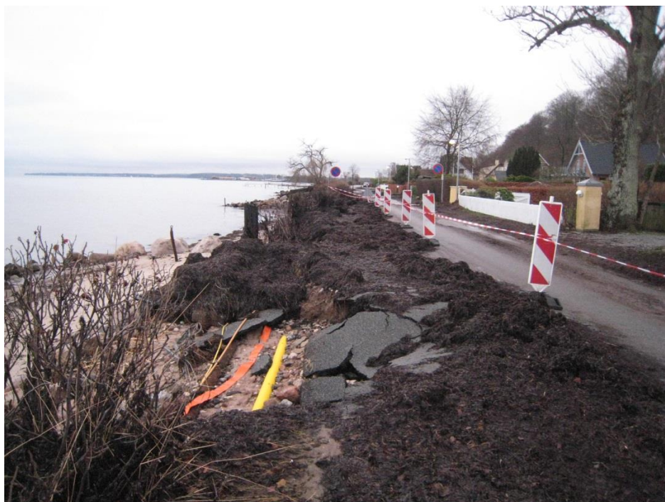
Figur 1.1: Erosion af Gl. Strandvej under stormen Bodil 5-6. december 2013. Det gule rør viser en gasledning og det orange kabel viser el-ledning, der var eksponeret for bølgepåvirkning under stormen.

Der er både foreslået en løsning, hvor der kun etableres erosionsbeskyttelse af vejen foran 252-256 og 165-169 og en løsning, hvor erosionsbeskyttelsen udvides med reetablering af strandhaver. En oversigt over området med erosionsbeskyttel-