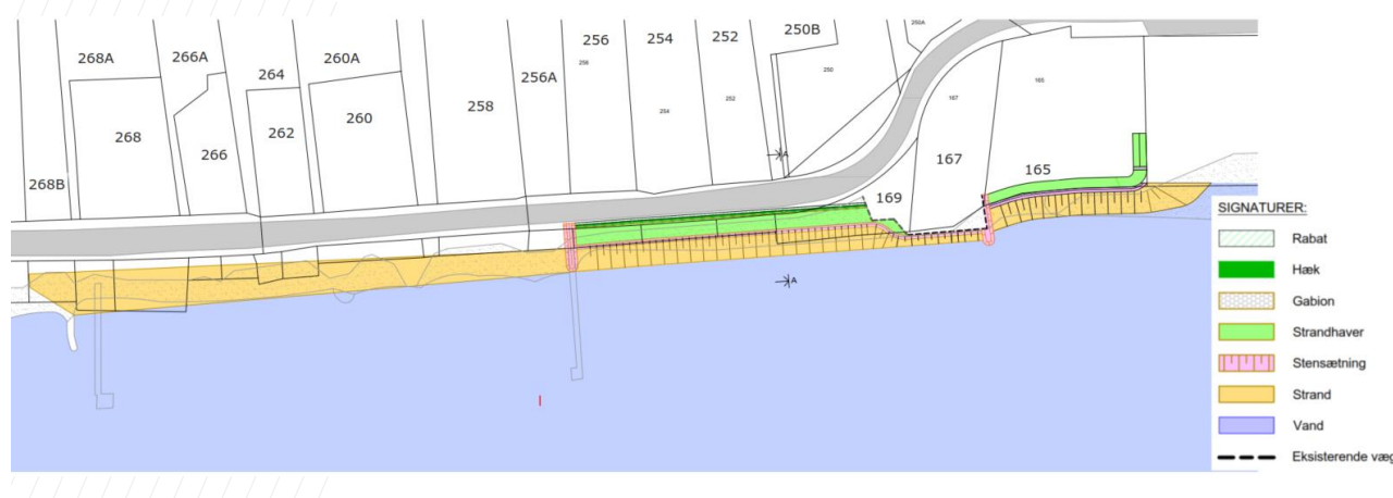
Figur 1.2: Oversigtskort med løsningsforslag med strandhaver.

Som del af erosionsbeskyttelsen strandfodres der for at kompensere for den reduktion i sedimenttransport, der vil forekomme ud for skråningsbeskyttelsen, når denne etableres. Der planlægges at strandfodre på strækningen 165 til 268B. For at holde på sandet etableres en hofde mellem matriklerne 256A-256 og mellem 167 og 165.